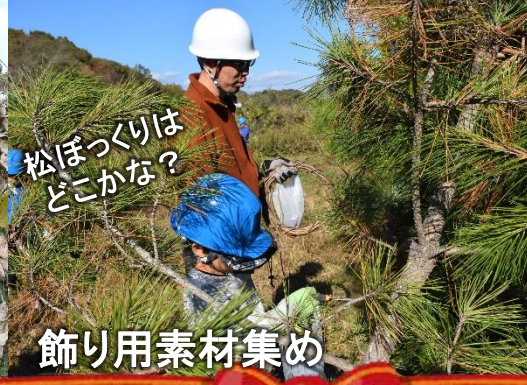
松ぼっくりはどこかな？