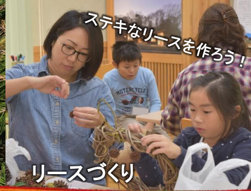
ステキなリースを作ろう！